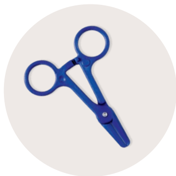
Afbeelding 1: De extra klem (kocher)